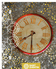
L'ART DÉCO UN PATRIMOINE D'EXCEPTION Art Deco, exceptional heritage